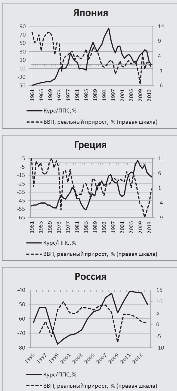
Рис. 3. Реальные темпы прироста ВВП и степень отклонения номинального валютного курса от курса по ППС к доллару в ряде стран, %

Примечание. Анализ проводился на основе имеющихся данных по 42 странам с 1960 г. Отрицательные значения (по левой шкале) показывают степень недооценки (в %) номинального курса относительно ППС, положительные – степень переоценки (в %).